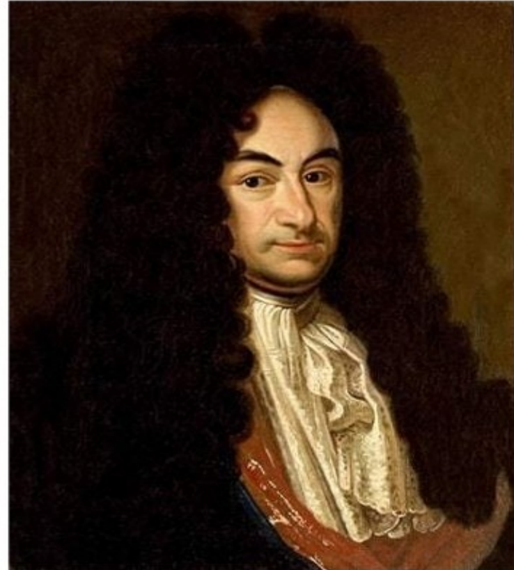
Готфрид Вильгельм Лейбниц 21.06.1646 – 14.11.1716 саксонский философ, логик, математик, механик, физик, юрист, историк, дипломат, изобретатель и языковед