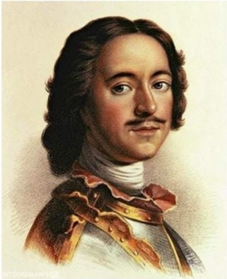
Петр Алексеевич Романов, 30.05.1672 – 28.01.1725, основатель Российской Академии Наук, последний царь всёя Руси и первый Император Всероссийский