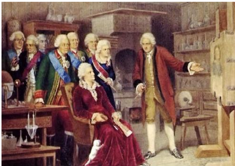
М.В. Ломоносов и Елизавета Петровна

Церемония торжественного открытия занятий в университете состоялась в день празднования годовщины коронации Елизаветы Петровны 7 мая 1755 года.