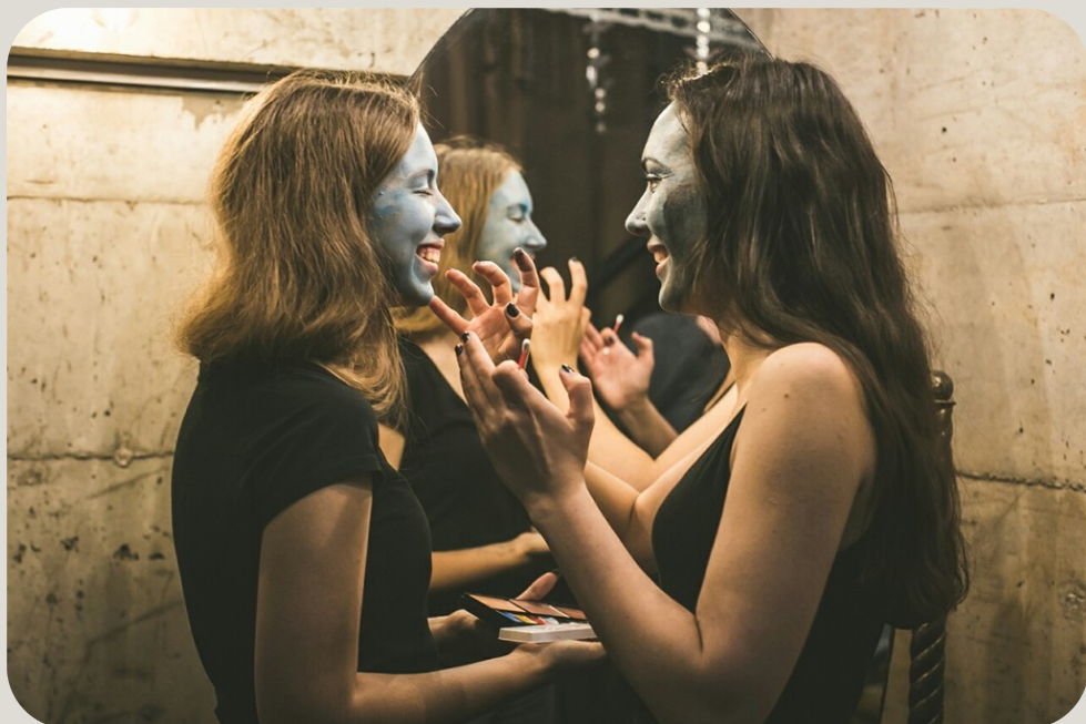
АКТЕР В ТЕАТРЕ